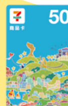
禮卷：500元 (5名)、100元 (25名)、50元 (100名)