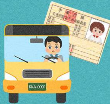
使用偽造、變造或矇領 之駕照駕車