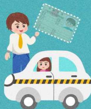
無駕照，卻以教導 他人駕車為業