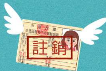
駕照已吊銷、 註銷仍駕車