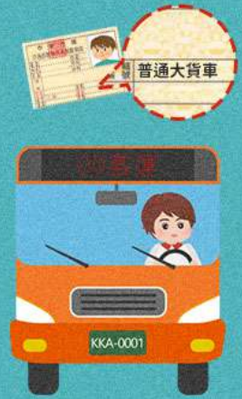
持大貨車駕照駕駛大客車、 聯結車或持大客車駕照駕駛 聯結車