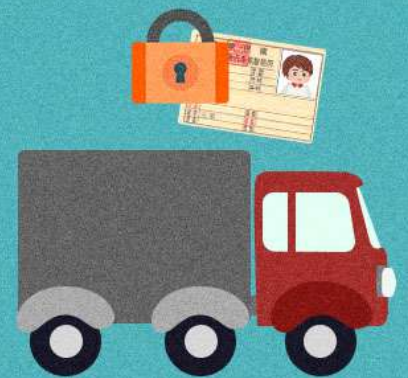
駕駛執照吊扣期間駕車