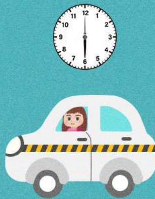
持學習駕駛證， 在未經許可的道路 或規定時間駕車