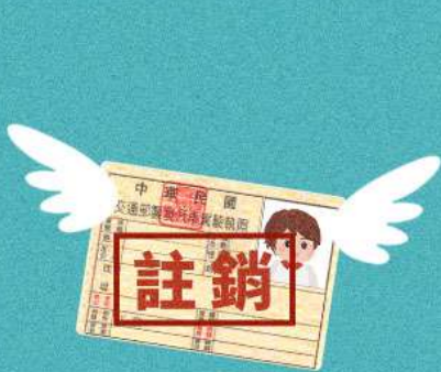
駕照已吊銷、註銷仍駕車