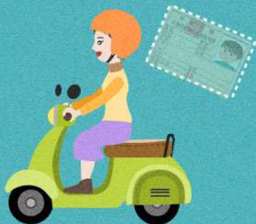
無照駕駛小型車 或機車