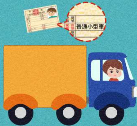
持機車或小型車駕照駕車