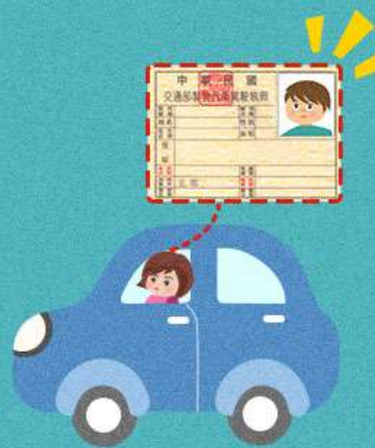
持偽造、變造或 矇領的駕照駕車