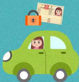
駕照吊扣期間 仍駕車