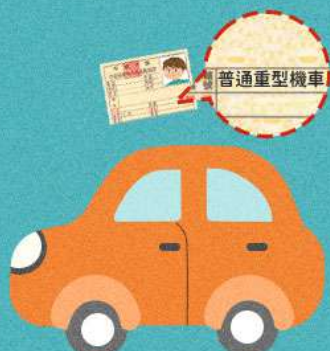
持機車駕照 駕駛小型車