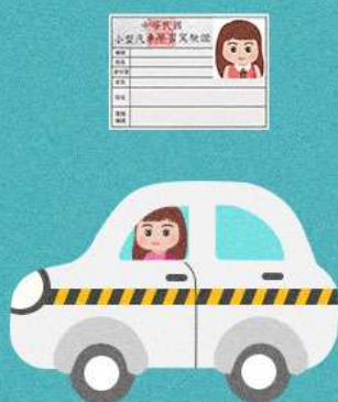
持學習駕駛證 在駕訓場外駕車， 且無有駕照者在旁指導